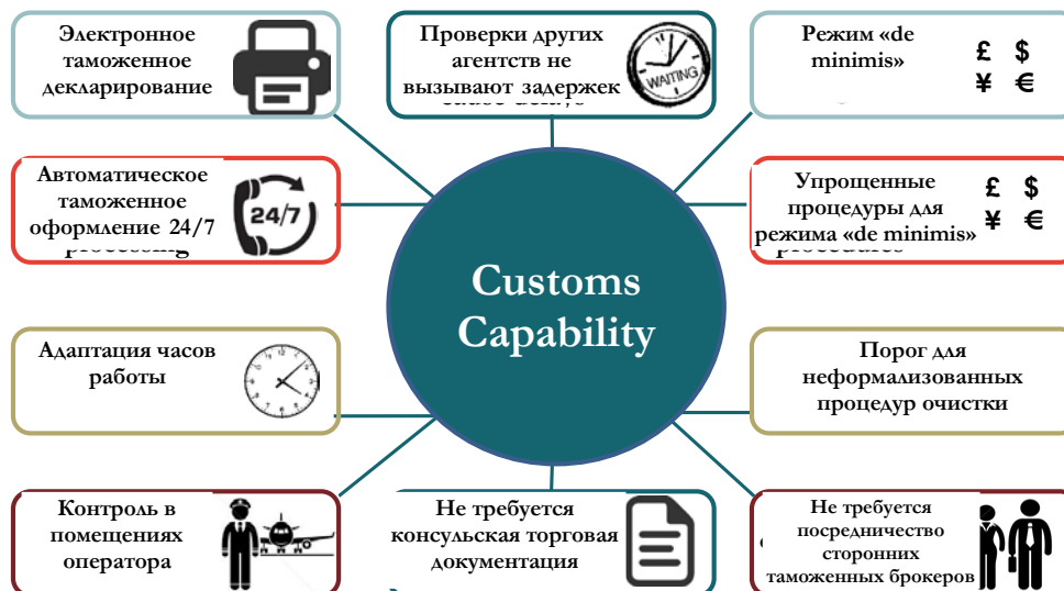
Рисунок 2. Обзор параметров пропускной способности таможни

Был сделан вывод о том, что даже с учетом влияния ряда ожидаемых факторов прослеживается устойчивая и статистически значимая связь между показателем пропускной способности таможни и товаропотоками в конкретную страну или из нее. В частности, было обнаружено, что реализация любой дополнительной меры из тех десяти, что образуют показатель ПСТ (например, автоматического таможенного оформления 24/7), для улучшения пропускной способности таможни повышает объем товаропотоков в стране в среднем на 4,4 %. Следует отметить, что, по нашим ожиданиям, этот эффект проявляется после определенного периода времени. Так, если Боливия реализовала бы две меры по улучшению пропускной способности таможни (например, автоматическое таможенное оформление 24/7 и адаптацию часов работы), можно прогнозировать, что товаропоток, направленный в Боливию и из нее, увеличился бы на 8,8 %, или на 2,03 миллиарда долларов. По аналогии с этим, если бы Камерун внедрил систему электронного таможенного декларирования, его товаропоток предположительно увеличился бы более чем на 670 миллионов долларов, или на 4,3 %. Наши проверки устойчивости связей подтверждают следующее.