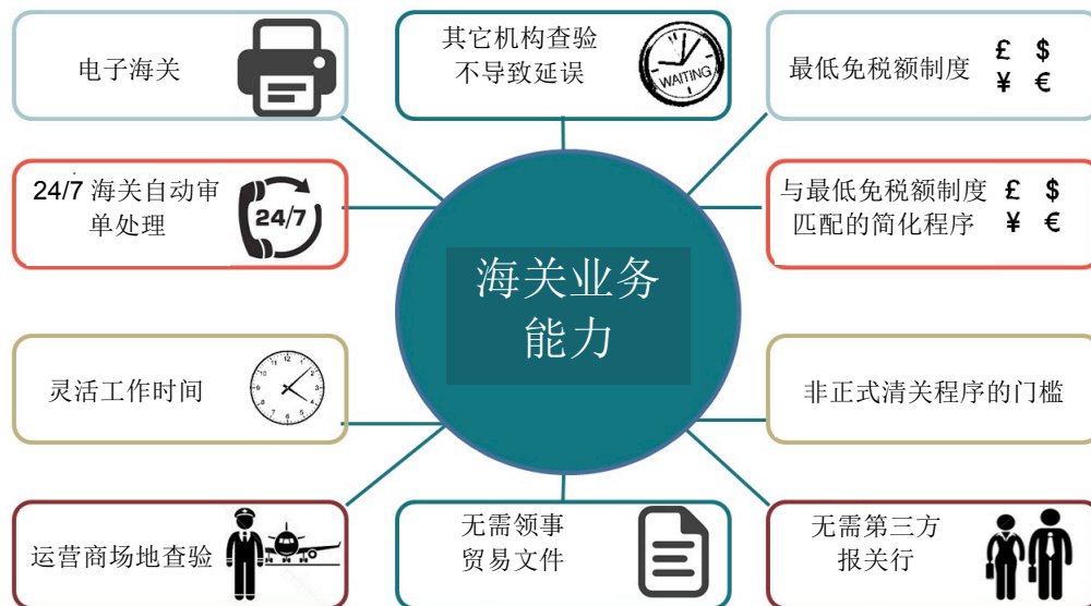
图 2. 海关业务能力措施概要

我们分析了海关业务能力、贸易和国际快递之间的关系。根据全球快递协会数据库的数据（如图 2 所示），我们重点分析了海关业务能力的 10 项具体措施。并根据这些措施构建了海关业务能力指数（CCI），用以记录各个国家已实施了多少项措施。