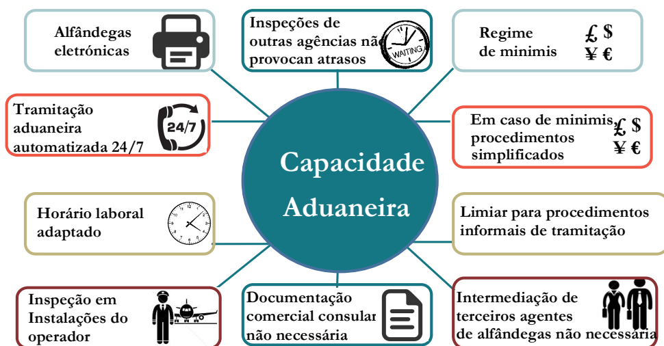
Figura 2. Visão geral de medidas de capacidade aduaneira

de empregos diretos como 1,3 milhões. Esse número baseia-se numa contagem efetiva (i.e. o número de pessoas empregadas) em vez de equivalentes a tempo inteiro.