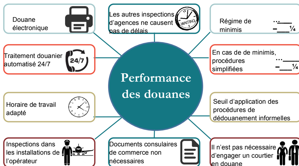
Figure 2. Aperçu des mesures de performance des douanes

Nous avons analysé la relation entre la performance des douanes, le commerce et les services de courrier express international. Notre analyse s’est concentrée sur dix mesures spécifiques de la performance des douanes, tirées de la base de données de la GEA. Ces mesures sont indiquées dans la Error! Reference source not found. Nous avons déterminé un Indice de Performance des Douanes (IPD) sur la base de ces mesures qui retiennent le nombre de mesures mises en œuvre dans chaque pays.